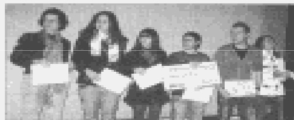
Entrega de premios del concurso, 2010-2011

la exclusión social está dentro y fuera de los centros. Por ello, es importante tener redes desde la escuela: el instituto con el entorno, con la familia, con las asociaciones, con otros profesionales, con los recursos de la comunidad que nos permitan comprender su entorno social, político, económico y cultural, para que desde una participación consciente y responsable, mejore nuestra calidad de vida y podamos estar integrados adecuadamente en él.